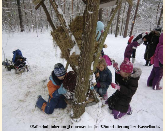
Waldschulkinder am Frauensee bei der Winterfütterung des Rasselbocks